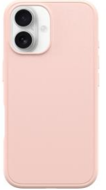
Ballet Shoes 77-96538 (Retail) 840304773589