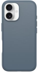
Bluetiful 77-96548 (Retail) 840304773688