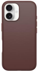
Union Station 77-96552 (Retail) 840304773725