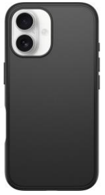
Black 77-96542 (Retail) 840304773626 77-96543 (ProPack) 840304773633