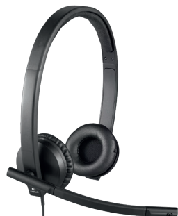
Logitech USB Stereo H570e testé par Natacha

☞ Confort : 5/5 – Son : 5/5 – Design : 4/5