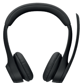
Logitech Zone 305 testé par Romane

Le 10h27 a eu la chance de tester 3 casques Logitech. Trois têtes, trois casques, trois avis bien tranchés.