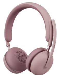
Logitech Zone Wireless 2 ES testé par Laura

☞ Confort : 4/5 – Son : 4/5 – Design : 3/5